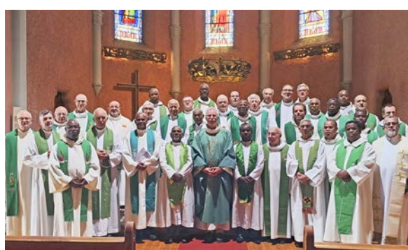
Messe de clôture de l'AG juillet 2025

Le pape François, avec sa lettre Tout est à l'amour , montre comment François de Sales a su percevoir les attentes spirituelles nouvelles de son époque, et a su y répondre. D'où le succès phénoménal de son Introduction à la vie dévote . Il manifeste combien la vie spirituelle peut s'inscrire pro-