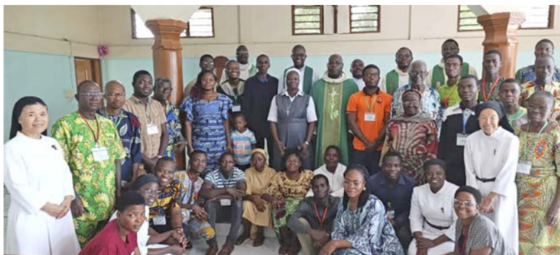
Journée Salésienne à Dassa (Benin), réunissant, Filles, Fils, Prêtres de saint François de Sales et sœurs SMMI