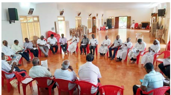
Rencontre de prêtres de saint François de Sales à Tanjore [Inde]

Les Prêtres de saint François de Sales ne sont pas très nombreux en France et dans le monde : à peu près 270 sont adhérents, et 500 s'associent à leurs activités. Toutefois, certaines régions connaissent un vrai dynamisme : l'Inde, Madagascar, le Rwanda,