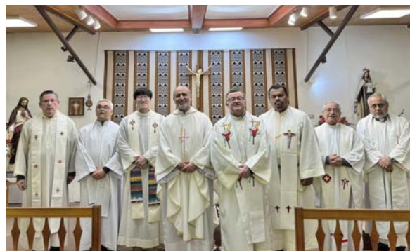
Réunion de prêtres de saint François de Sales au Chili

le Bénin, le Chili, l'Argentine... Lorsque nous nous retrouvons en assemblée internationale, comme c'était le cas début juillet à Annecy, nous nous émerveillons de la fraternité que nourrit notre commune référence à l'évangile et à la spiritualité salésienne.