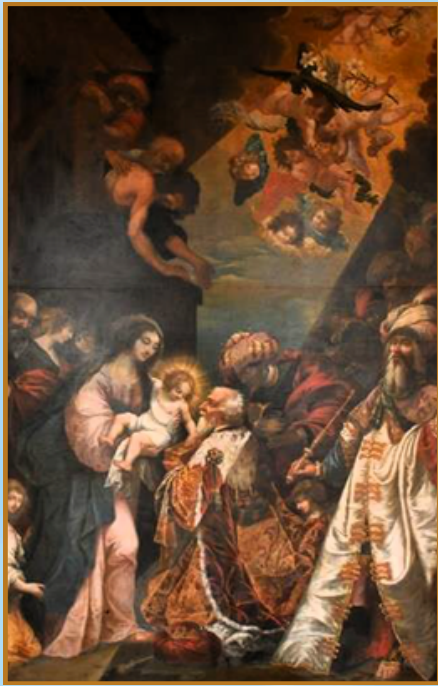
L'adoration des Mages de Mathurin Bonnecamp, prochainement dans la Cathédrale de Nantes

Les mages se sont mis en route pour se présenter à Jésus. Ils viennent de très loin et de différents pays.