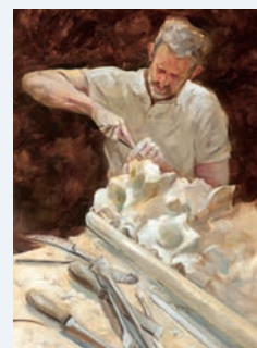
Sculpture d'une frise, Laurence Bost

Exposition Les gardiens du Geste , de Laurence Bost et rencontre avec des artisans, à la préfecture le 20 septembre (sur inscription).