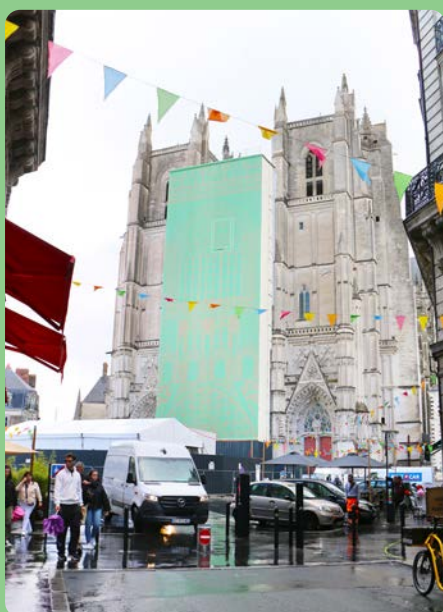
Diocèse de Nantes

Pour les paroisses et groupes constitués qui souhaiteraient, à compter d'octobre, venir en pèlerinage à la cathédrale, n'hésitez pas à vous rapprocher du secrétariat de la cathédrale pour proposer des dates. → Permanence du lundi au vendredi de 9h à 12h. paroisse@cathedrale-nantes.fr Voir