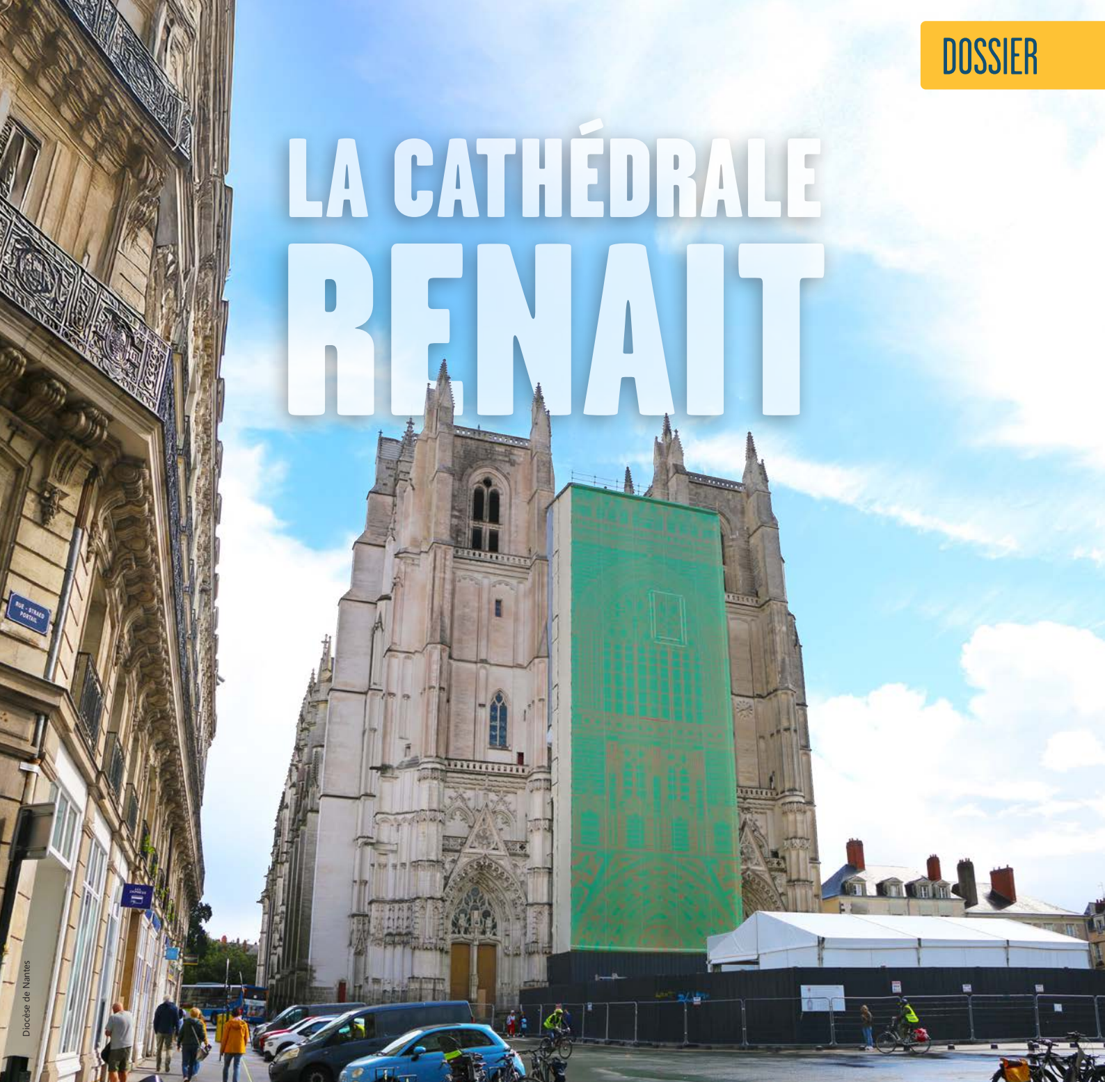
Diocèse de Nantes

Nous sommes à quelques jours de la réouverture de la cathédrale de Nantes, après cinq années de travaux. Si les travaux vont se poursuivre encore durant 3 ans, l'édifice est rendu au culte et à ses visiteurs, chercheurs de sens, amateurs de patrimoine... Le programme de cette réouverture est à présent dévoilé, le voici dans ce dossier, introduit par quelques mots de notre évêque : « Je forme le vœu que cette réouverture soit un moment fort de joie partagée, une occasion précieuse de redécouvrir la beauté et la richesse de notre cathédrale. Qu'elle soit un temps de fraternité pour l'Église diocésaine, et bien au-delà, pour l'ensemble des habitants de la Loire-Atlantique. Car cette cathédrale, par son histoire, sa présence et sa symbolique, appartient à chacun d'entre nous. »