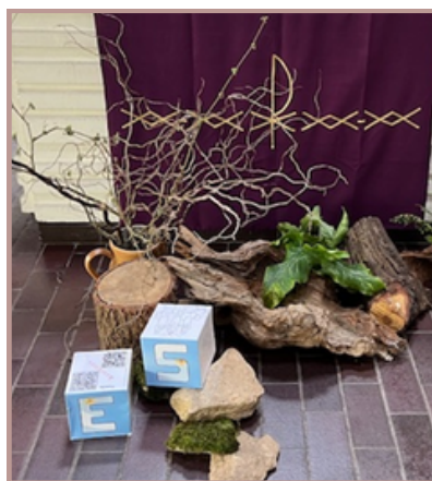
Église St Étienne Paroisse St Yves

Nous sommes entrés dans la 2ème moitié du carême, ce temps de conversion qui nous achemine vers la grande fête de Pâques. Vous êtes nombreux à nous avoir commandé des 'cubes du carême'. Nous espérons que cette proposition vous aide à vivre ce temps dans vos groupes, vos paroisses ... Comme pour nos différentes initiatives, nous attendons vos retours : des photos, des commentaires ... sur la façon dont vous avez utilisé les cubes.