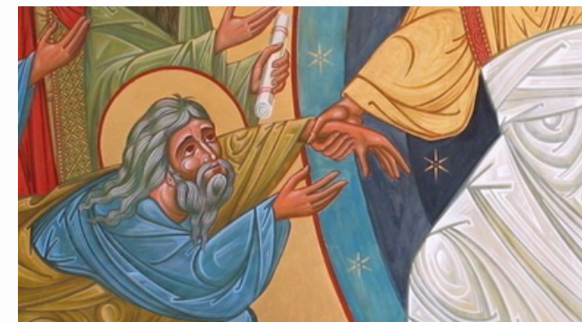
Icône de la Résurrection (détail), église de Villars-les-Dombes (Ain)