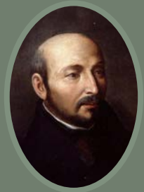
Saint Ignace de Loyola (1491-1556)

« Seigneur Jésus, apprenez-nous à être généreux » est devenue la prière commune des mouvements scouts catholiques.