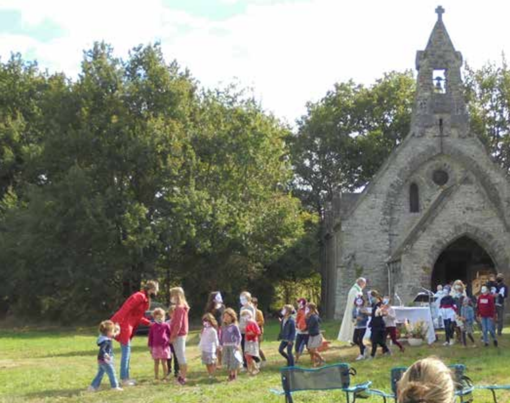
Messe de la Création à Riaillé, le 6 septembre 2020