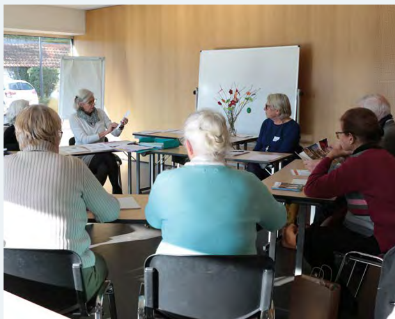
Diocèse de Nantes

Nous ne pouvons pas cheminer seuls dans la foi. La participation à une équipe de chrétiens est