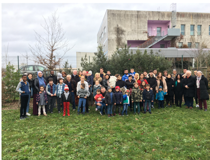
Photo de groupe prise à la fête des familles de janvier 2020

Je prends en main ma vie et celle de mes filles. Il est temps de se faire une raison et aller de l'avant. Je passe par des épreuves difficiles mais je décide de sortir de la dépression, tristesse, etc... La vie est devant nous et Dieu nous accompagne."