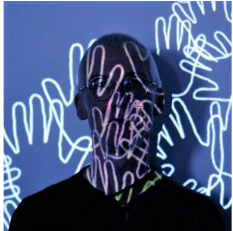
Christophe Viart © Collectif Intersectio

Ses oeuvres font partie de collections privées et de collections publiques (FRAC Bretagne, BPS 22, Charleroi...)