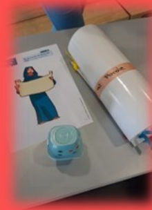
Le rouleau de la Parole