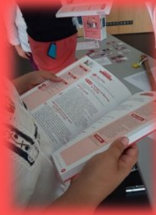
Le livre de l'animateur