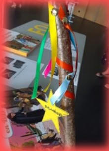
Le bâton qui accompagne l'équipe